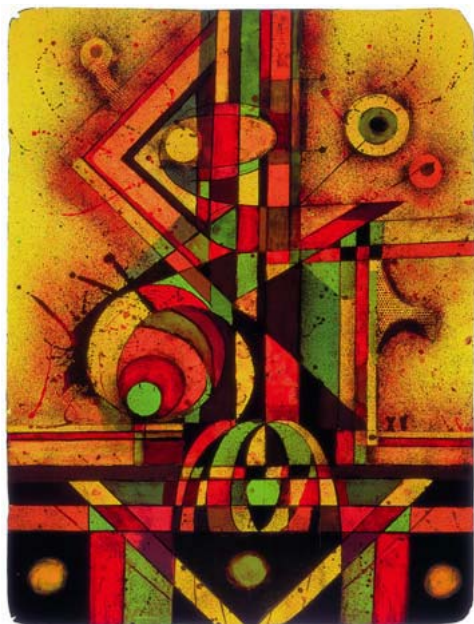
Z PROFILU, BAREVNÉ LITO, 2000, 65 x 46 cm