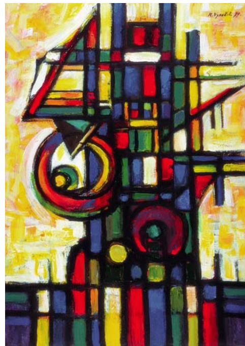
PROFIL, AKRYL, 1999, 90 x 68 cm

Denmark, Belgique, France, Italia, Japan, BRD, Canada, Mexico, Rossia, Polska, España, Norge, Sweden, Suomi, Iran, England, Australia, Öesterreich, Holland.