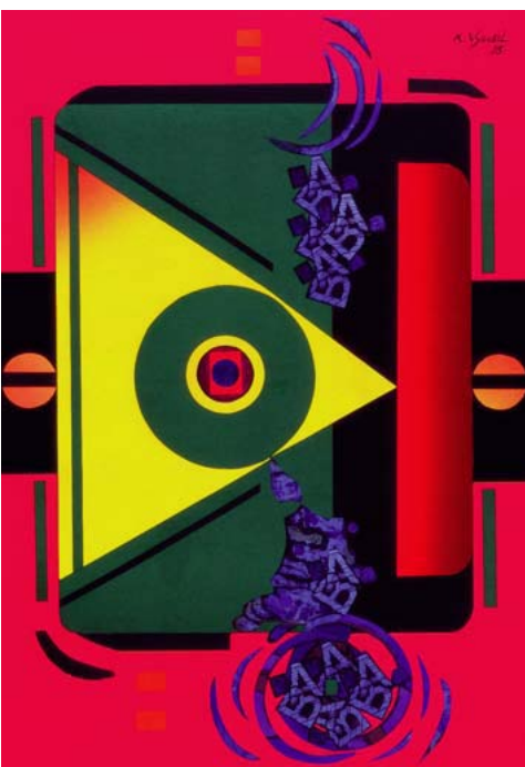
V PROSTORU, KOLÁŽ, 1995, 120 x 90 cm