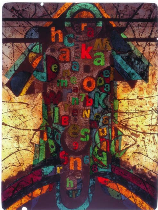
POEZIE POD STŘECHOU, BAREVNÉ LITO, 1994, 64 x 44 cm