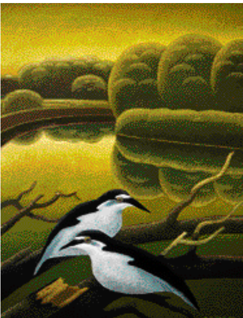
KVAKOŠI NA DYJI, 2002, 65 x 50 cm

Každá úvaha o Vojtkovi musí vycházet z toho, že máme co do činění s básníkem. Na počátku je básník. Je to banální zjištění, ale kladu je na začátek, aby bylo jasné, o čem je řeč: že totiž jeho poetičnost, jeho metafory, jeho vidění jihomoravské (přesněji pálavské) skutečnosti – že to není jen něco umělého, něco navíc, něco zvenčí dodaného, že to není jenom věc žánru, rozmaru a osobních zálib, že tu jde o něco hlubšího, o sám postoj ke světu, o možnou existenci na něm. Všudypřítomná tajemnost praveku mu diktuje malířský postoj ke krajině, ve které žije.