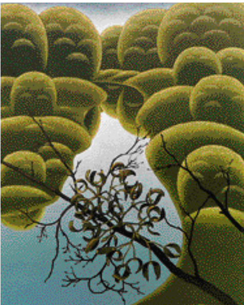
JMELÍ NA POHANSKU, 1999, 80 x 65 cm