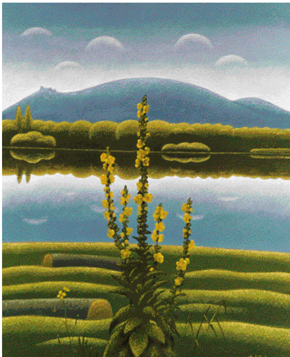
KRAJ POD PÁLAVOU, 2000, 75 x 60 cm