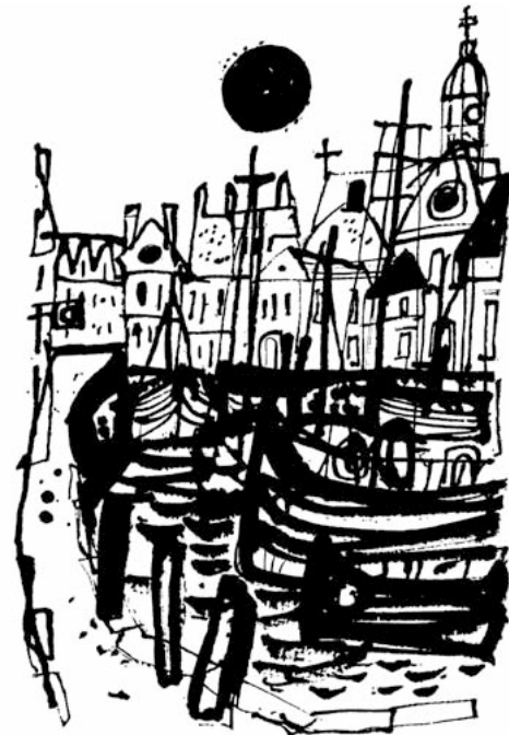
ILUSTRACE KE KNIZE B. TRAVENA LOĎ MRTVÝCH, 1979, LAVÍROVANÁ KRESBA, 19 x 13 cm