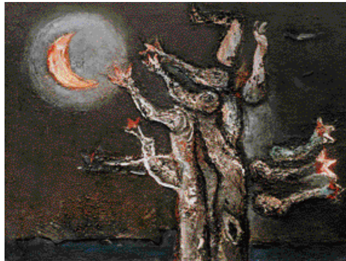
ADVENT - TOUHA PO SVĚTLE, OLEJ, PLÁTNO, 1997, 65 x 80 cm

1958 Praha - Galerie mladých, s Pilařem, Papouškem, Hegrem