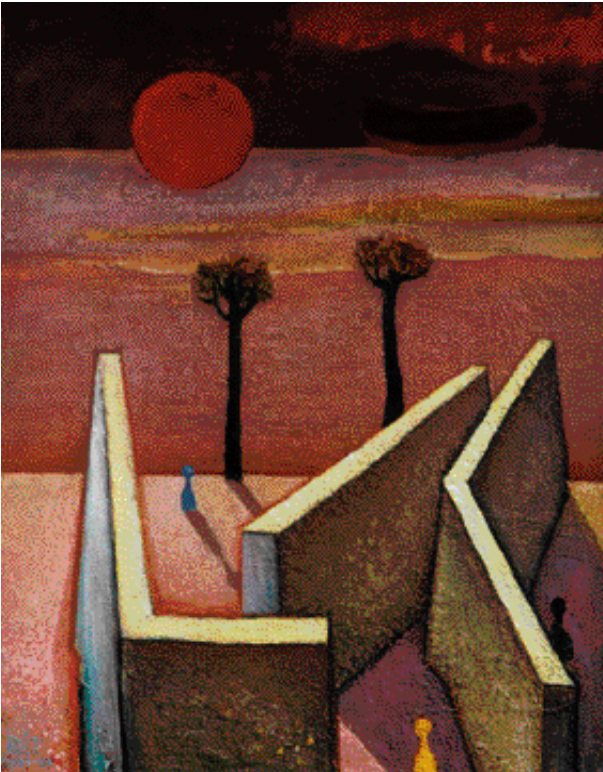
ČLOVĚČE NEZLOB SE, OLEJ, PLÁTNO, 2003, 100 x 80 cm