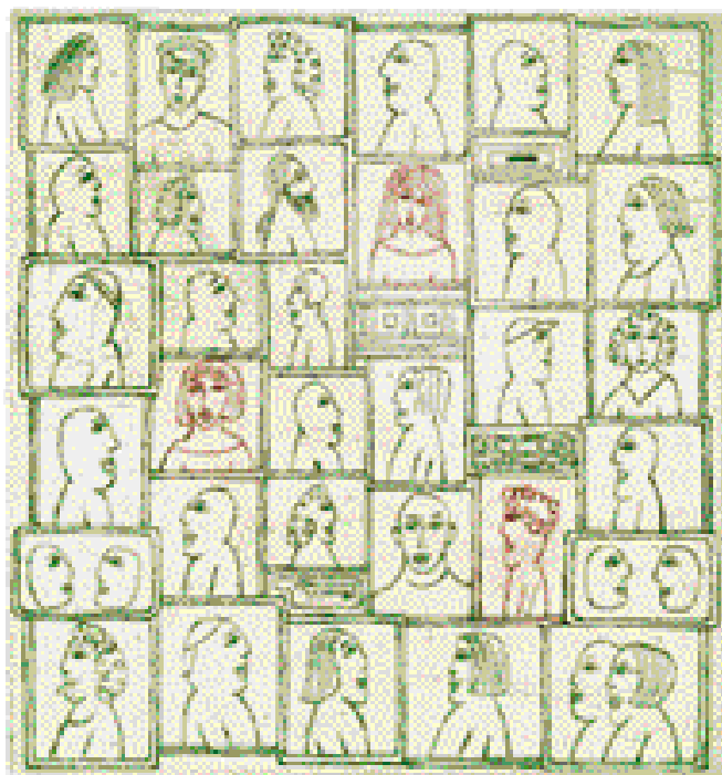
ŽÁDNÉ NOVÉ ZPRÁVY, SUCHÁ JEHLA, 2003, 194 x 183 mm