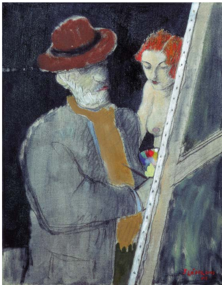
MALÍŘ A MODEL, OLEJ, PLÁTNO, 2003, 60 x 47 cm