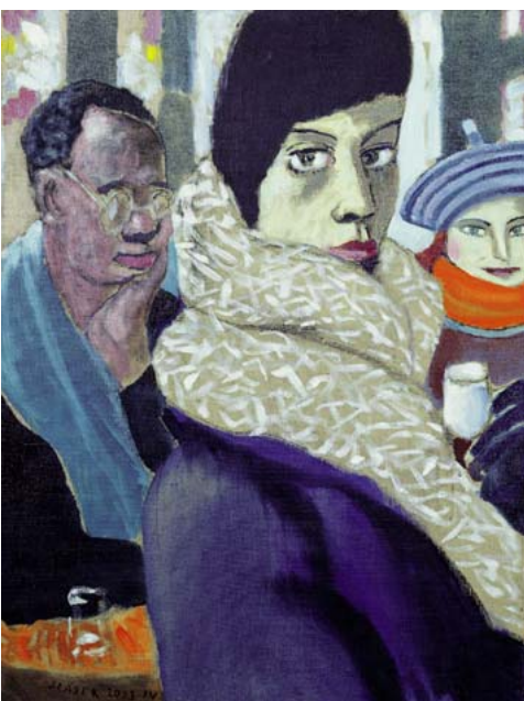
CAFÉ V RUE DES RENNES, OLEJ, 2003, 66 x 50 cm

Sládkova malířská a kreslířská, svým charakterem komorní tvorba zachycuje především každodenní realitu, kterou autor osobitým způsobem dotváří v nezaměnitelné umělecké dílo. I když figurální témata, jež jsou mu nejbližší, nepostrádají prvky grotesknosti, mírnou deformací postav se snaží spíše vystihnout jejich bezprostřední výraz, momentální rozpoložení. Smysl pro vyjádření poetiky všednosti prokázal již v době studií v sérii Metafyzických zátiší (1964) a zvláště pak v rozměrném anekdoticky pojatém obraze Děství Morseovo (1967), jež je v majetku NG v Praze. Jeho odmlčení se v 70. letech nebylo náhodné. Věnoval se tudíž tvorbě filmových plakátů, v nichž s vrozeným smyslem pro humor a nadsázku uplatňoval vedle fotografické montáže sugestivnost volné kresby, mnohdy inspirovanou lidovou tvořivostí (Takže ahoj - 1970, Rodinný život - 1972, Kdyby - 1973, Sbohem pane profesore - 1974, Dostihová horečka - 1977 aj.). Pro nakladatelství Merkur navrhoval knižní přebaly, ilustroval povídky v nedělní příloze Mladé fronty. K samotné malbě se vrátil až počátkem 80. let po odjezdu do Paříže. Odlišné prostředí mu poskytlo jistotu životní a tvůrčí svobody. Tehdy se plně rozvinula Sládkova schopnost zachycovat jedinečnost oka-