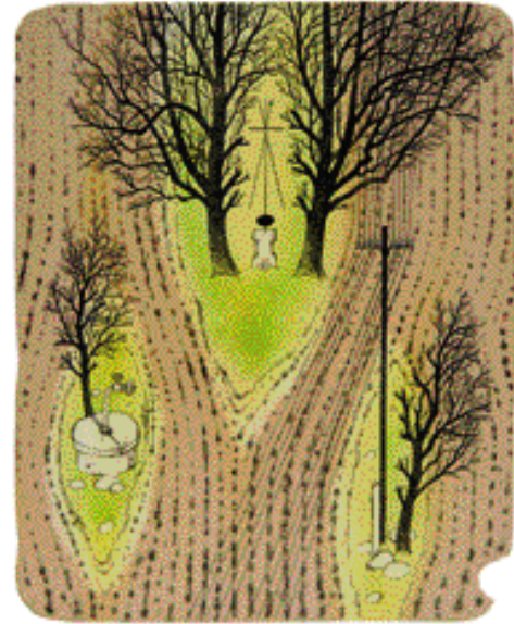
TŘI OSTROVY, BAREV. LITOGRAFIE, 24,5 x 29,5 cm

cích melancholicko-ironického ražení, je charakteristická i pro volnou tvorbu Pavla Sivka. V ní má – vedle jedinečných kreseb – od konce osmdesátých let stále výraznější místo litografie. Kreslířský základ, kreslířské východisko Sivkova vyjadřování je v ní umocňováno barevností, která s tichou rafinovaností (charakteristické jsou často takřka nepostřehnutelné posuny od reálné k významové barevnosti) vyzývá naši vnímavost k soustředěnému sledování a dešifrování jeho sdělení.