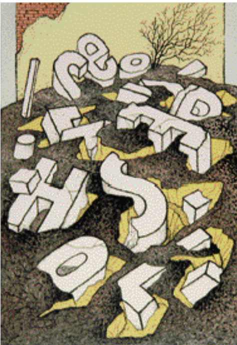
NÁLEZ ZA DOMEM, BAREV. LITOGRAFIE, 14 x 20 cm