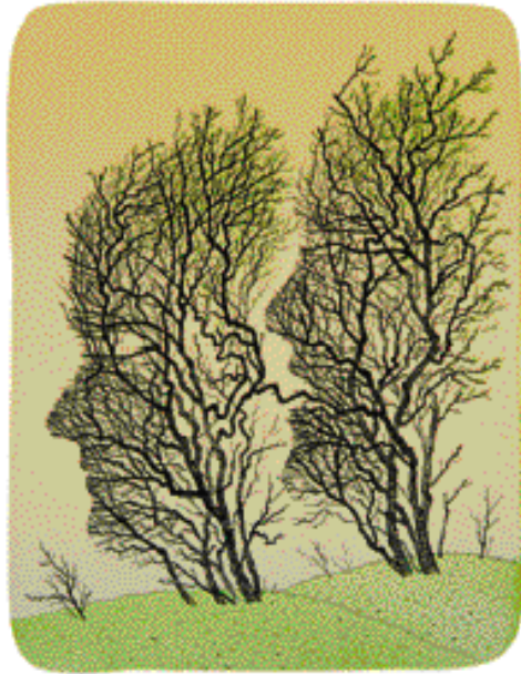
KLEVĚTA, BAREV. LITOGRAFIE, 19 x 24,5 cm