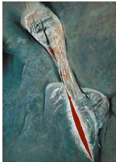
DOLOROSA, KOMB. TECHNIKA, 1991, 130 x 90 cm

■ Národní galerie Praha, sbírka moderního malířství ■ Národní galerie Praha, grafická sbírka ■ Národní galerie Praha, sochařská sbírka ■ Ministerstvo kultury ČSFR ■ Galerie hl. města Prahy ■ Památník národního písemnictví, PNP Praha ■ Středočeská galerie, Praha ■ Moravská galerie v Brně ■ Galerie umění Karlovy Vary ■ Galerie moderního umění