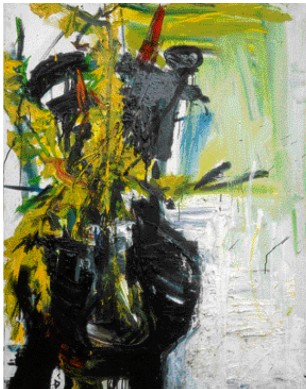
ZLATÝ DÉŠŤ, 1983, OLEJ, 140 x 110 cm