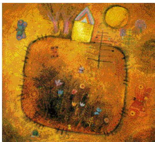
ZAHRADA S MOTÝLEM OLEJ, PLÁTNO 45 x 50 cm (1975)