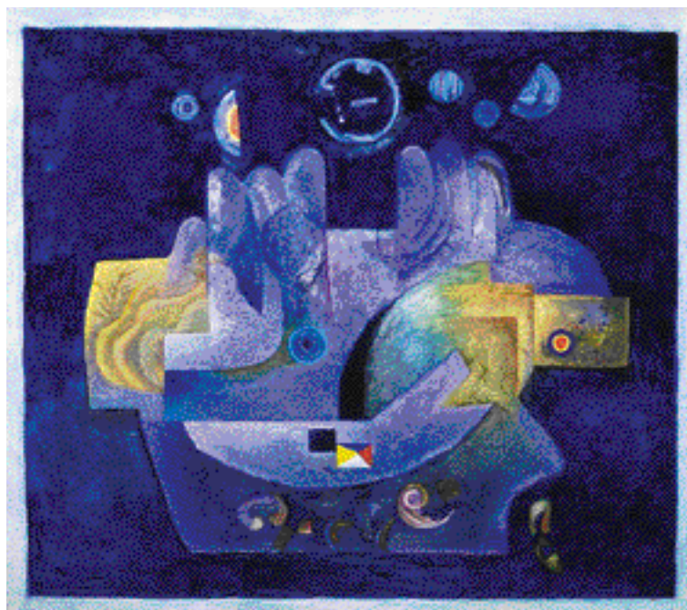
SEN O OSTROVĚ OLEJ, PLÁTNO 70 x 75 cm (1990)

Josef Paleček patří k čelným představitelům oné silné generace ilustrátorů, která se v 60. a 70. letech postarala o mimořádnou výtvarnou úroveň i evropskou proslulost české knihy pro děti. Dětský svět, jeho figurální, věcné i krajinářské motivy, stejně jako dětsky čistý a výtvarně výrazný metaforický způsob vidění, jsou však i základem charakteristické poetiky Palečkových obrazů, grafik, pérových kreseb, ale i tapiserií, které spoluvytvářejí dílo podivuhodné jednoty.