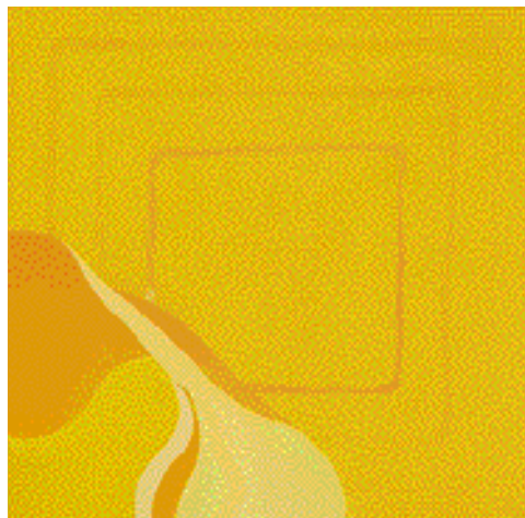
Z CYKLU - GENESIS 130 x 140 cm

Vztah otce a syna Jiřího a Igora Müllerových jaksi přirozeně sám o sobě předurčuje dva generační pohledy na současnou problematiku výtvarného umění, a to jak ve výtvarném souznění, tak i v konfrontačních střetnutích.