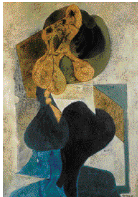
MELANCHOLIE, OLEJ NA PLÁTNĚ, 2003, 130 x 89 cm