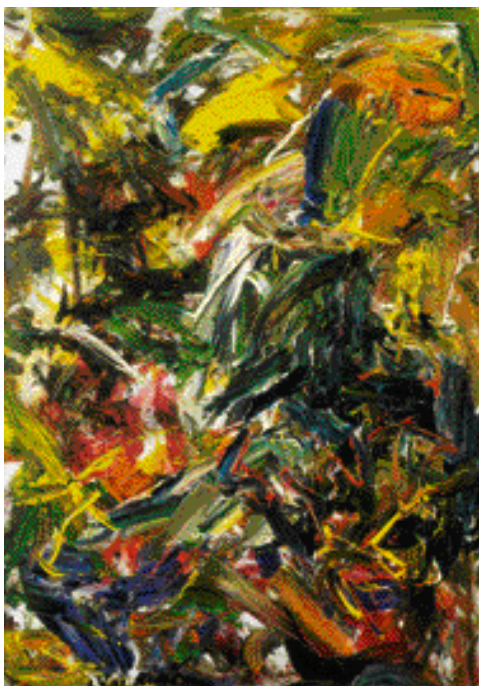
POTOK, 2002, OLEJ, 80 x 61 cm