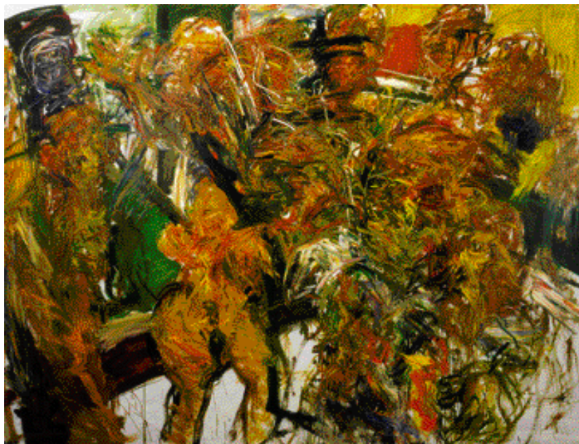
V HOSPODĚ, 2001, OLEJ, 206 x 275 cm

■ 1978 Nový Jičín, Nová galerie Žerotínského zámku • Frenštát pod Radhoštěm, Městské muzeum ■ 1983 Hukvaldy, škola L. Janáčka • 1984 Hukvaldy, škola L. Janáčka ■ 1986 Ostrava, Dům kultury Vítkovic ■ 1987 Frýdek-Místek, Okresní vlastivědné muzeum, zámek ■ 1988 Prešov, Galerie výtvarného umění ■ 1989 Praha, Galerie Vincence Kramáře ■ 1990 Havířov, Výstavní síň Viléma Wünsche ■ 1991 Vídeň, Galerie für moderne Kunst Tiller • Ostrava, Galerie Kopeček ■ 1992 Praha, Atrium • Ostrava, Studio Della • Ostrava, Galerie výtvarného umění • Opava, Dům umění ■ 1993 Třinec, Galerie Helga • Ostrava, Galerie Chagall • Nový Jičín, OVM • Frýdlant nad Ostravicí, Gymnázium ■ 1994 Hukvaldy, restaurace Pod Hradem • Frenštát pod Radhoštěm, Městské muzeum ■ 1995 Příbor, Muzeum • Praha, Křížová chodba Karolina • Ostrava, Vysoká škola báňská ■ 1996 Ostrava, Klub Atlantik • Ostrava, Nová radnice • Praha, Národní technické muzeum • Ostrava, Galerie na chodbě • Ostrava, Klub Amos ■ 1997 Brušperk, Národní dům • Frýdek-Místek, Zámek • Olomouc, ČSOB • Praha, Mánes • Ostrava, GVU • Karlovy Vary, Galerie Atrium ■ 1998 Plzeň, Západočeská galerie • Krnov, Galerie „A“ • Brušperk, Galerie Svatoplukova centra ■ 1999 Ostrava, Studio