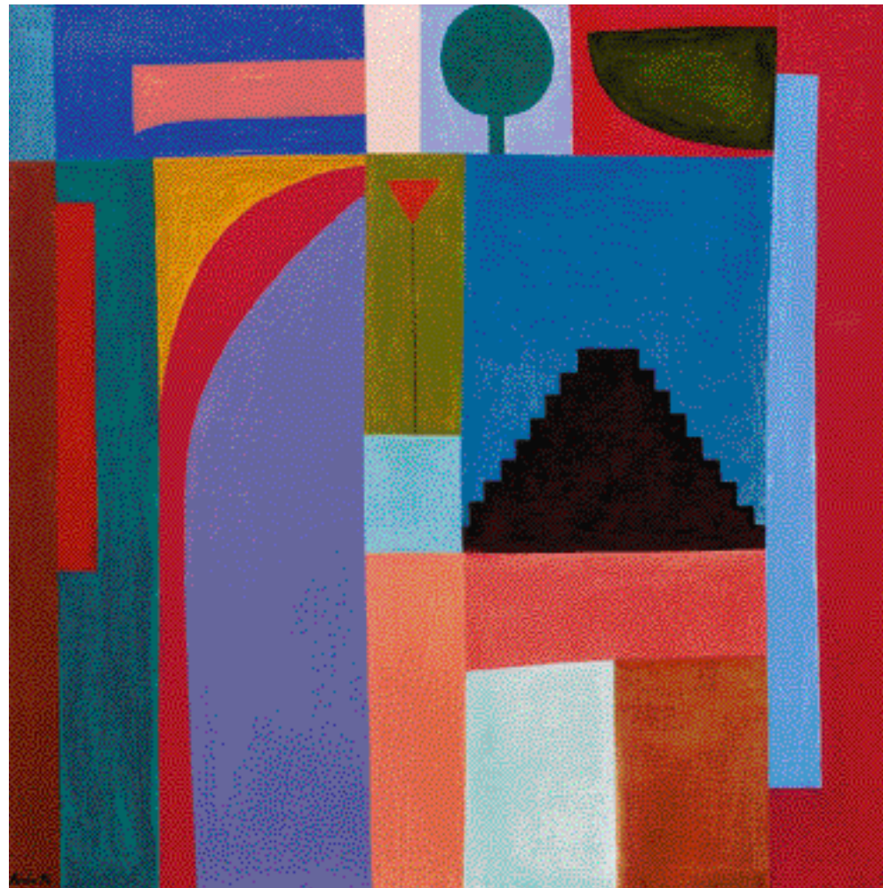
PYRAMIDA, 1994, 150 x 150 cm

Kromě ruské avantgardy se v některých dílech objevuje inspirace indiánskou kulturou.