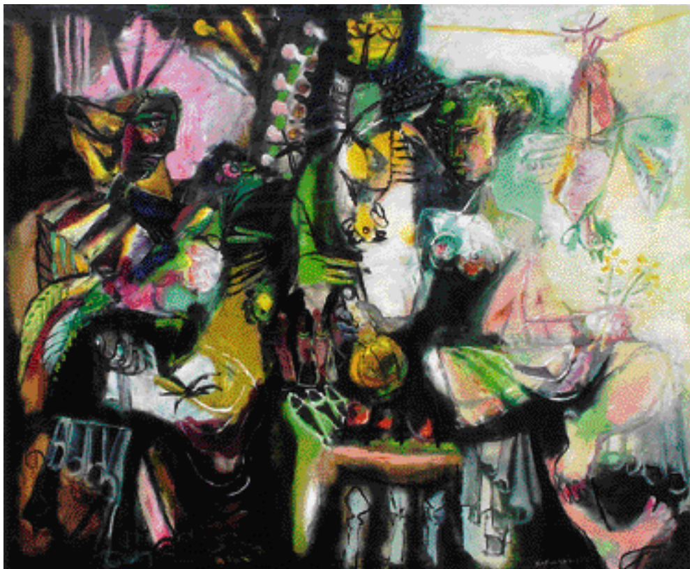
NA ITALSKÉM TRHU, OLEJ NA PLÁTNĚ, 1996, 125 x 150 cm

Přes 50 samostatných výstav a samozřejmě mnoho společných doma i v zahraničí.