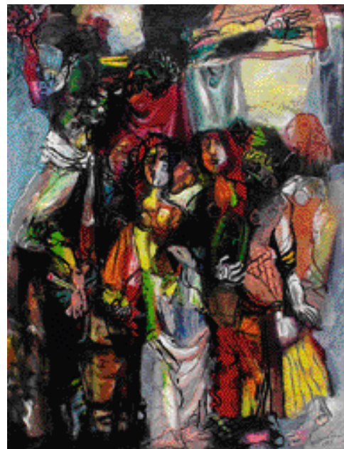
UKŘIŽOVÁNÍ, OLEJ NA PLÁTNĚ, 1996, 150 x 125 cm