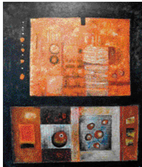
OVOCE RAJSKÝCH STROMŮ JÍME, 2002, 135 x 115 cm

DNES malíř, divadelní a filmový herec, básník, zpěvák a muzikant, všestranný umělec, jakých není mnoho. Žije a pracuje v Praze, v Podkrkonoší a někdy také v Paříži.