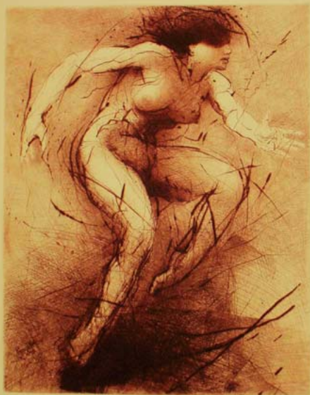
NAD ZEMÍ, 291 x 230 cm