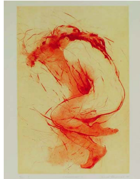
NÁSLEDOVAT, 490 X 325 cm

■ 1999 „Grafika“, Klub Malaché, Praha - ČR; „Bez odpovědí“, Galerie Kaplička, Hodonín - ČR; „Grafika a kresba“ Galerie Zingst, Zingst - SRN;