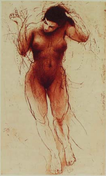
TYTO RUCE, 490 x 297 cm

■ 2004 „Sněhové království“ Zadov na Sumavě - ČR; „Grafika“, Národní dům, Prostějov - ČR; „Grafika a malba“, Villa Vista, Las Vegas - USA