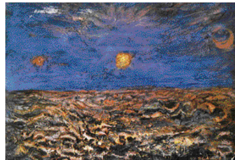
GOBI, 1990, OLEJ, 50 x 70 cm