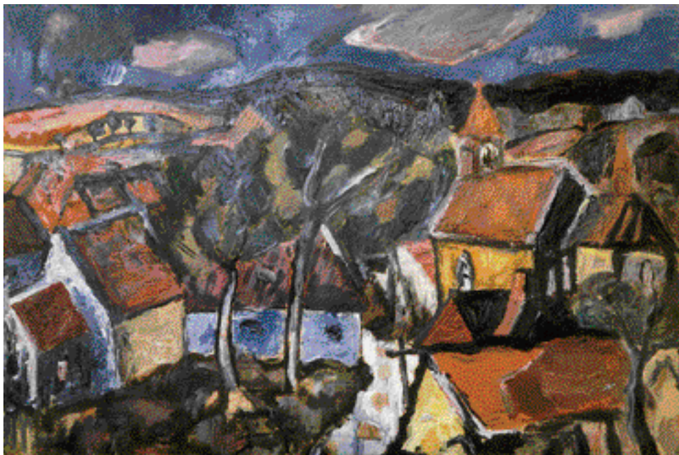
KOSTELNÍ LOUČKY, 1965, OLEJ, 50 x 70 cm

Žije a maluje na Maloskalsku v Křížkách a v Praze.