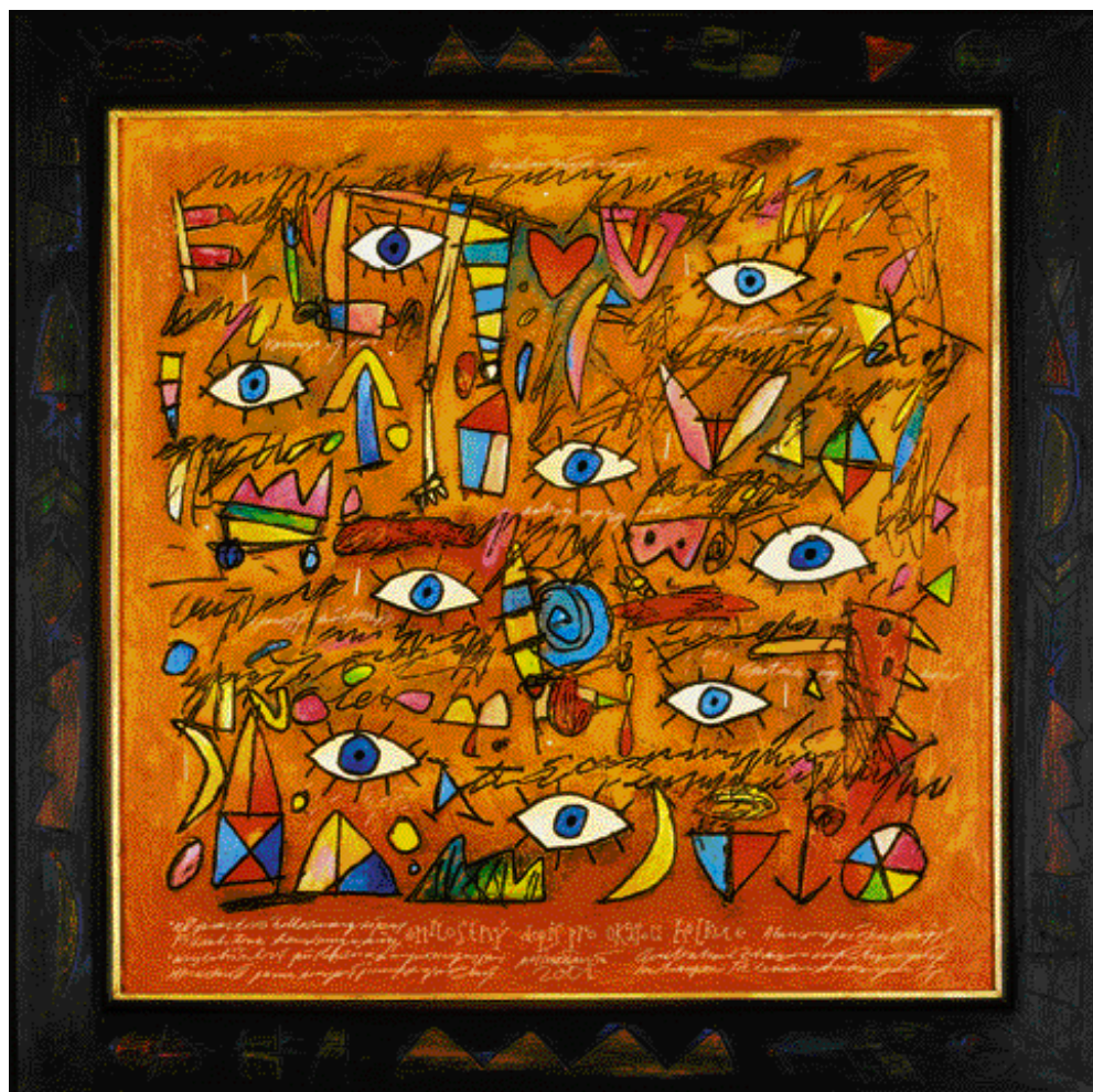
MILOSTNÝ DOPIS PRO OKATOU HOLKU, 2001, 66 x 66 cm A LOVE LETTER FOR A GIRL WITH BEAUTIFUL EYES, 2001, 66 x 66 cm