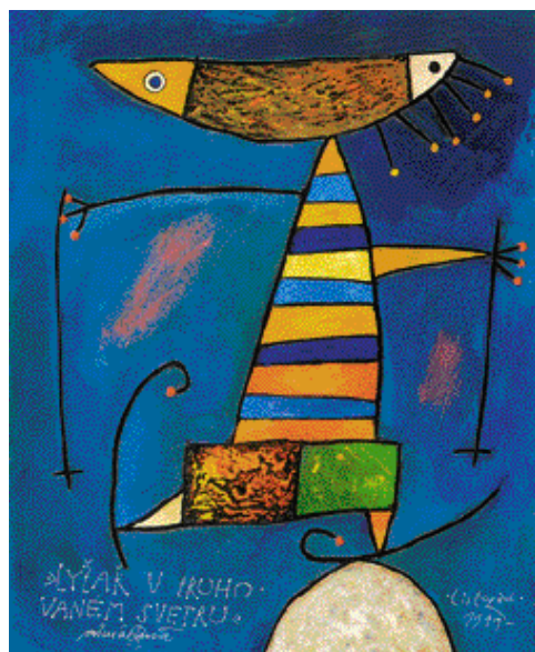
LYŽAŘ V PRUHOVANÉM SVETRU, 1999

Dvorana, Brno • Galerie Parnas, Brno • Galerie Chagall, Brno • Galerie Kincová, Zlín