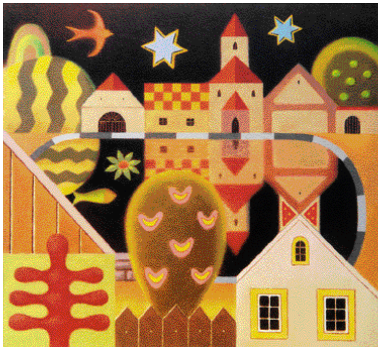
VESNICKÝ RYBNÍČEK, OLEJ, 1999, 39 x 41 cm

Jeho díla jsou citlivou reakcí člověka na přírodu, ze které vzešel a jejíž je součástí. Skutečnost výtvarník pokorně přefiltrovává do svého obrazového světa romantické poetiky a tvarové i barevné harmonie. Jemné doteky štětce a vrstvení lazur podtrhují tajemně pohádkový obsah, který odpovídá lidské povaze malíře. Tato technika předpokládá určité vlastnosti jako je přesnost a trpělivost, které malíř patrně zdědil po svých rodičích a prarodičích, u kte-