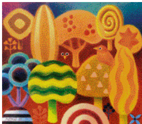
LES LISTNATÝ, OLEJ, 1999, 40 x 45 cm

Od roku 1989 uspořádal dvanáct samostatných výstav, svá díla představuje na společných výstavách i v zahraničí. Z jeho prací se těší nejen v Rakousku, Švýcarsku, Izraeli, Velké Británii, ale i v Japonsku.