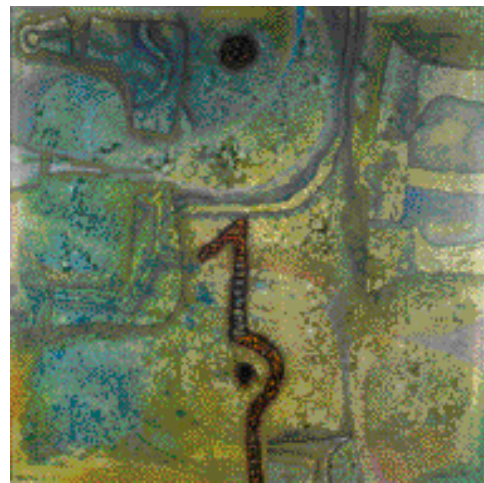
STŘEŽENÍ ZELENÍ, 72 x 72 cm