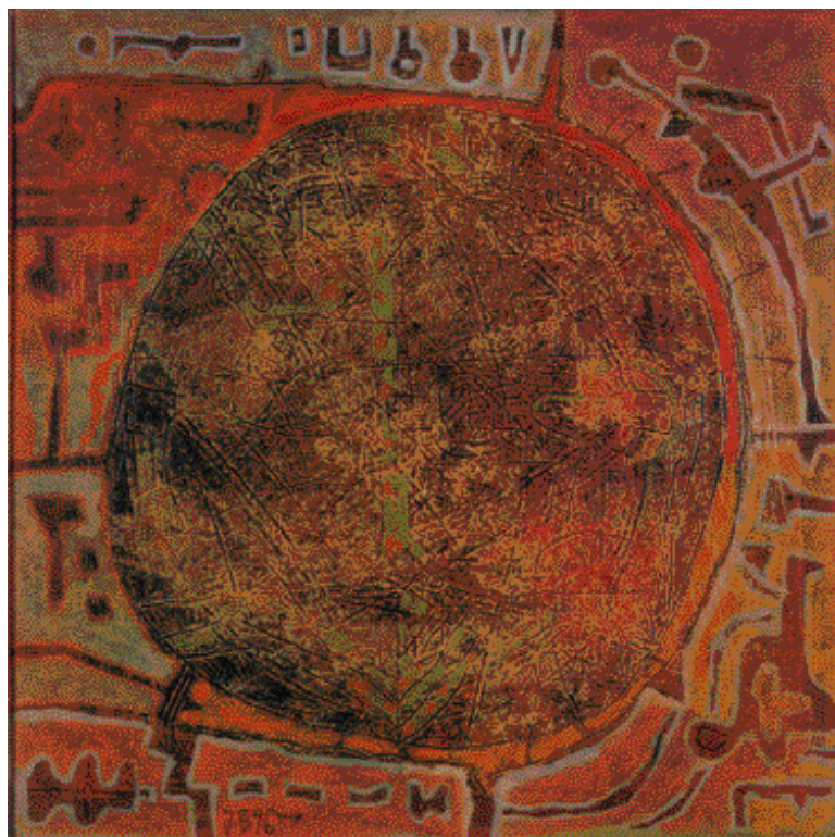
Z KRUHU, 27 x 27 cm

Náboženství, rituály, magie a modlitba užívají symbolu, jejich jazyk nám zprostředkovává přístup k poznatku, že existují na opačné straně našeho objek-