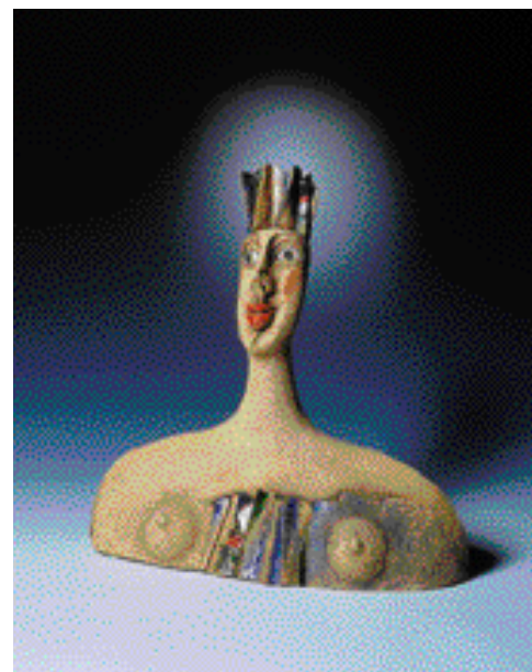
KRÁLOVNA, výška 39 cm

Od roku 1998 se zúčastnila několika společných výstav: