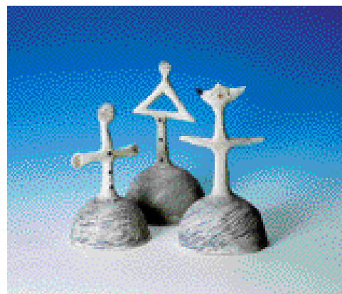
ZVONKY, výška 28cm

Vejdeme-li do její dílny, překvapí nás mimořádný pořádek: žádné zbytky hlíny, nikde skvrnky od dotyků dlaní, jen úzkostlivá čistota a ustálený řád. Na zdech jsou pověšeny kresby, které znázorňují jednotlivé fáze vývoje budoucích plastik, vidíme, jak se figury proměňují než získají svou budoucí podobu. A v malém proutěném kufříku najdeme prvotní skicy, které definitivním studijním kresbám předcházely. Tento postup nás utvrzuje v názoru, že Jaroslava Brázdová promyšleně a cílevědomě buduje své „panáky“, snaží se ze své tvorby vyloučit nahodilost a laciný efekt.