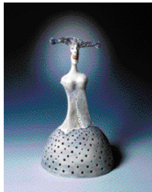
SVĚTLUŠKA, výška 40 cm

I když spolupracuje s několika galeriemi, převážná část její tvorby vzniká pro potěchu přátel a pro radost z práce a řemesla jako takového.