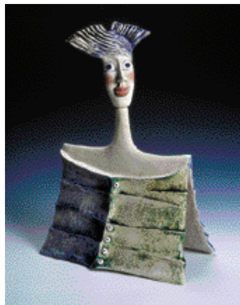
JINANOVÁ PANENKA, výška 52 cm

Tvůrců mnoho, ale jen někteří pochopili, že hlína je „živá“ hmota, kterou zase jen „živé“ ruce mohou změnit v krásné předměty, plastiky, nevšední objekty.