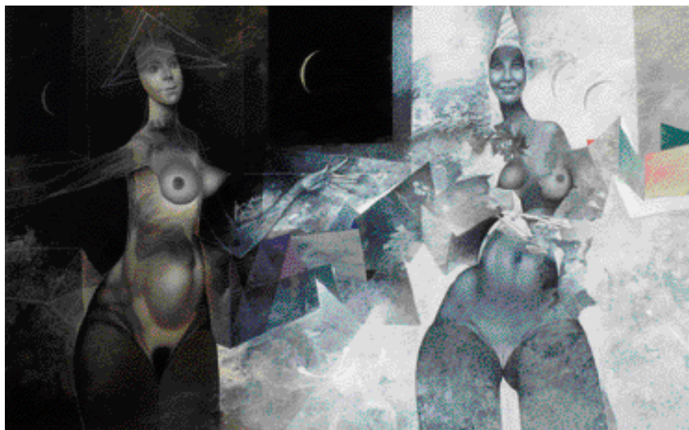
DNEM I NOCÍ, KOMBINOVANÁ TECHNIKA, 2003, 50 x 80 cm

• 1982 Frederikshavn/Dánsko, Interexlibris • 1985 Lodž/Polsko, Malé formy grafiky • 1986 Frederikshavn/Dánsko, Norimberk/Německo, Dürer v Exlibris – 1. cena • 1987 Toronto/Kanada, 2. ročník mezinárodní výstavy miniaturního umění – čestné uznání • 1988 Toronto/Kanada, 3. ročník mezinárodní výstavy miniaturního umění – čestné uznání • Sopoty/Polsko, 2. mezinárodní triennale grafiky „Mezzotinta 88” – čestné uznání • 1989 Chrudim, Triennale českého Exlibris – čestné uznání • 1991 Sint-Niklaas/Belgie, Mezinárodní bienále Exlibris – cena města Sint-Niklaas • Boechout/Belgie – „Boechout 91” – čestné uznání za malbu • 1996 Malbork/Polsko, 16. Bienále moderního Exlibris – čestné uznání a 2. místo za nejlepší kolekci Exlibris • 2002 Varese/Itálie, Mezinárodní soutěž Exlibris – 3. místo • Malbork/Polsko, Bienále moderního Exlibris – čestné uznání • 2003 Ankara/Turecko, 1. Mezinárodní soutěž Exlibris – čestné uznání • Vilnius/Litva, XIII. Mezinárodní soutěž Exlibris – čestná medaile.