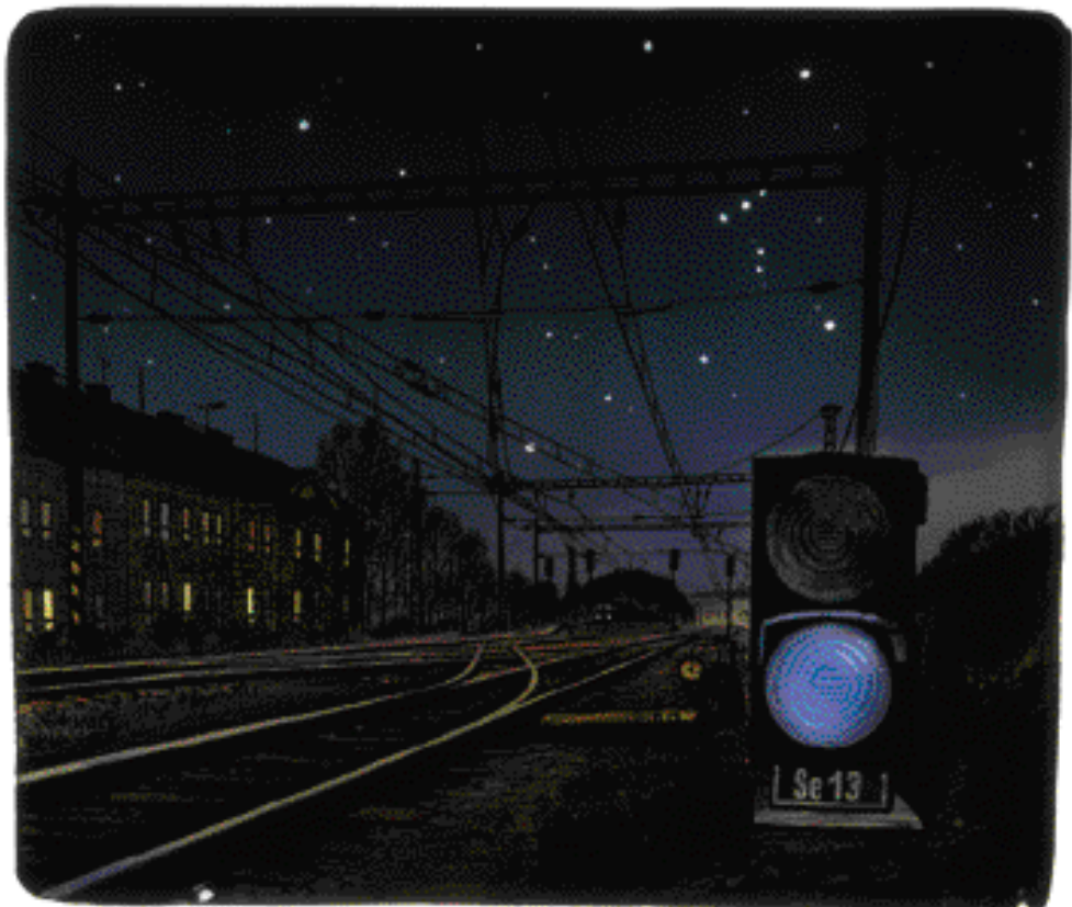
MODRÝ TRPASLÍK, LITOGRAFIE, 1993, 32 x 37 cm

Pro každého umělce je charakteristické, že si vytváří svůj svět, který popisuje svým vlastním nezaměnitelným rukopisem. Jiří Bouda je vyhraněnou malířskou osobností a jeho práci poznáme na první pohled. Většina jeho grafických lis-