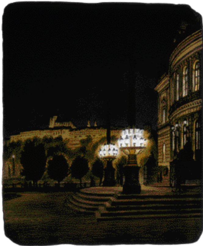
PRAŽSKÉ JARO, LITOGRAFIE, 1993, 32 x 27 cm