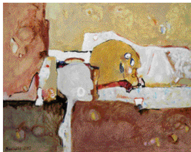
MRAMOROVÁ HORA, OLEJ, 2002, 75 x 95 cm

Spolupracuje s architekty při realizaci interiérů významných budov. Například hotel Mövenpick, Renaissance, bank Hypovereinsbank, Raiffeisenbank, Komerční banky. Jeho díla jsou zastoupena v mnoha zemích v soukromých i veřejných sbírkách.