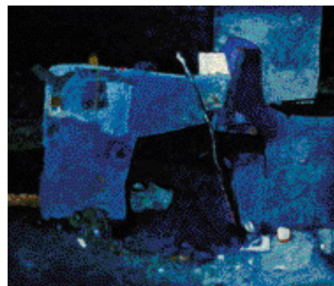
POD PŘEHRADOU, OLEJ, 2003, 90 x 105 cm