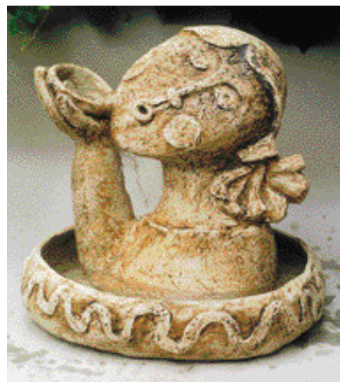
DOUŠEK ČISTÉ VODY – fontána, PATINOVANÝ ŠAMOT, vel. 41 cm