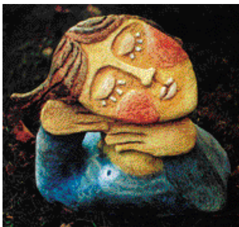
ZASNĚNÁ, POLYCHROMOVANÝ ŠAMOT, vel. 42 cm