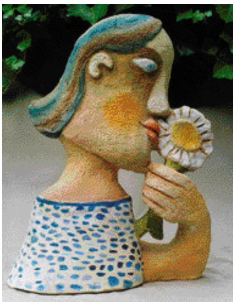
KOPRETINKA, POLYCHROMOVANÝ ŠAMOT, vel. 43 cm