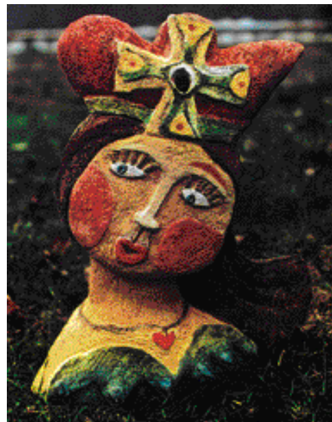
KRÁLOVNA, POLYCHROMOVANÝ ŠAMOT, vel. 45 cm

Žije a pracuje v Dobré Vodě u Českých Budějovic.