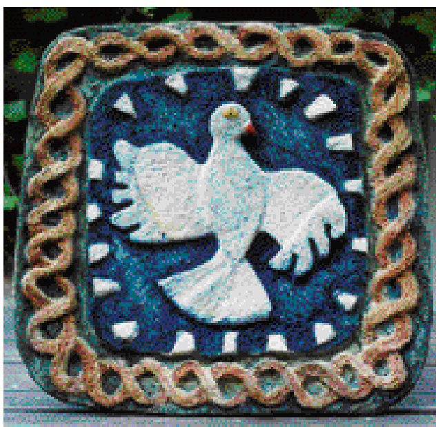
HOLUBIČKA, KACHEL – ŠAMOT, 30 x 30 cm